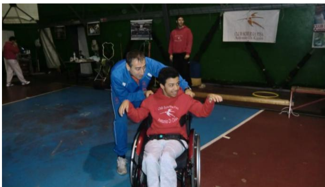
Enrico met gehandicapte.

Van 1988 tot 2000 trainer/coach van atleten in een rolstoel.